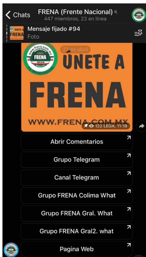
Figura 1. Canales de WhatsApp y Telegram de FRENA

En el marco de la Jornada Electoral 2021, FRENA realiza una evaluación de los candidatos a puestos de representación. Gilberto Lozano, la figura pública del movimiento,