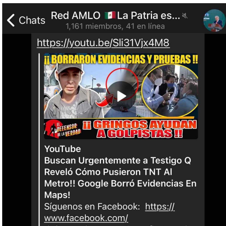
Figura 6: Ejemplo de publicación en Telegram

A diferencia de las plataformas de Facebook y Twitter que han desarrollado mecanismos para prevenir la difusión de noticias falsas, otros servicios de mensajería como Telegram presentan un rezago en la materia debido a sus características.