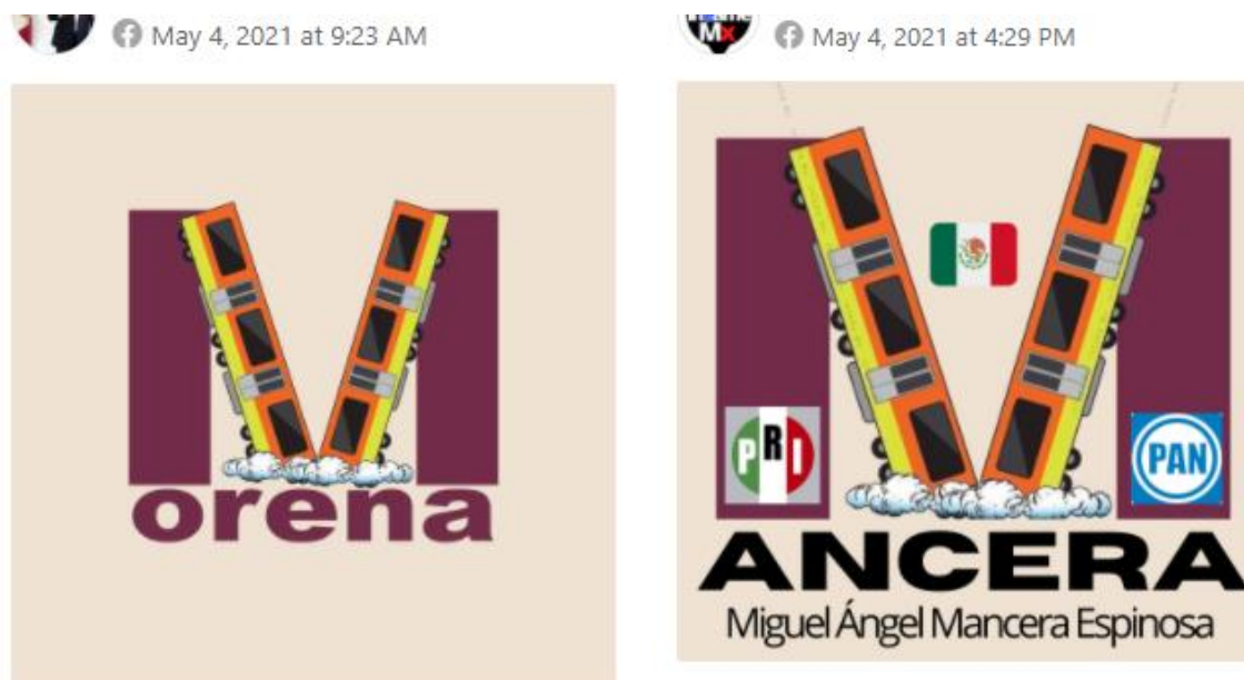
Figura 1. Memes y disputa por la narrativa en redes sociales

El martes 4 de mayo, gran parte de las publicaciones en distintas redes sociales giraron alrededor del incidente y los eventos que le sucedieron como la búsqueda de las personas desaparecidas. Un grupo de panistas locales aprovechó para utilizar a familiares de víctimas y buscar denunciar a la jefa de gobierno. Las críticas en redes sociales se encendieron rápidamente acusándolos de oportunistas y lamentando que quisieran sacar ventajas políticas en este periodo de campaña electoral.