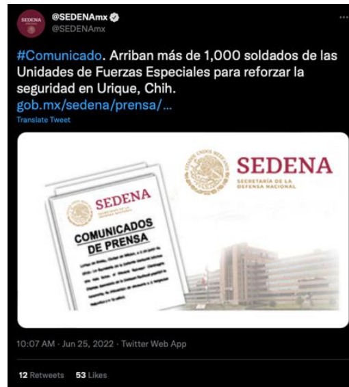
Imagen 3. Captura de pantalla del comunicado de prensa tuiteado por la cuenta de la Sedena el 25 de junio de 2022

Cuando analizamos el caso San Cristóbal de las Casas, encontramos que las cuentas de la Sedena y la Guardia Nacional no publicaron en ninguna red social sobre los hechos. Esta vez su presencia fue mínima, pero sin duda se encontraron más activos.