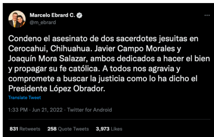
Imagen 5. Captura de pantalla del tuit que tuiteó Marcelo Ebrard sobre los hechos de Cerocahui

Marcelo Ebrard condenó los asesinatos en un tuit más breve, pero con mayor alcance: 3973 likes y 2,972 respuestas. Valdría la pena remarcar que la diferencia entre la publicación de Monreal y Ebrard fue apenas de 47 minutos.