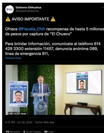
Imagen 1. Captura de pantalla del tuit más relevante sobre el caso Cerocahui en la cuenta de Twitter del Gobierno del Estado de Chihuahua

Entre los comentarios más repetidos destaca la impunidad para delinquir de el Chueco desde 2017, el ofrecimiento de recompensas cuando no se trata de “gente común” y la corresponsabilidad del gobierno federal al retirar fuerzas federales de la zona.