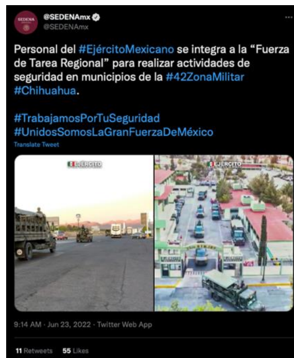
Imagen 2. Captura de pantalla del tuit de la Sedena informando que se integrarían en la Fuerza de Tarea Regional en la #42ZonaMilitar, No se menciona directamente a Urique o Cerocahui

No hubo mención directa por parte de ambas instituciones ni en sus redes sociales o en sus comunicados de prensa. Sin embargo, la Sedena tuiteó que se integraría a la Fuerza de Tarea Regional. De acuerdo con el comunicado que publicaron el 25 de junio se trató de 1000 militares que fueron encomendados a reforzar la seguridad en el municipio de Urique. 1