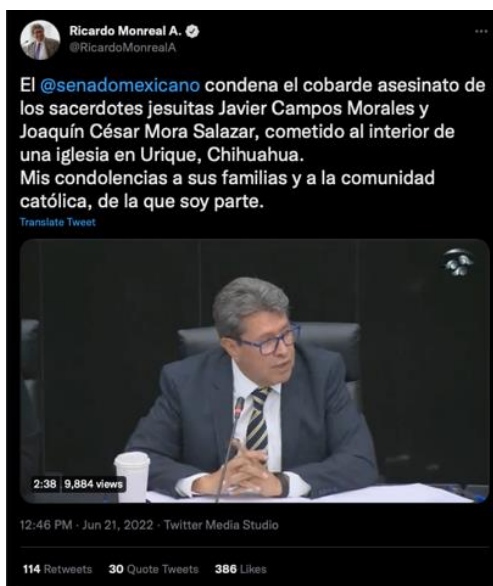
Imagen 4. Captura de pantalla del tuit y video que tuiteó Ricardo Monreal sobre los hechos de Cerocahui

Marcelo Ebrard condenó los asesinatos en un tuit más breve, pero con mayor alcance: 3973 likes y 2,972 respuestas. Valdría la pena remarcar que la diferencia entre la publicación de Monreal y Ebrard fue apenas de 47 minutos.