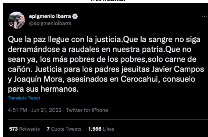
Imagen 6. Captura de pantalla del tuit y video que tuiteó Epigmenio Ibarra sobre los hechos de Cerocahui

Otras figuras como Pedro Miguel o John Ackerman se abstuvieron de emitir declaraciones, el primero retuiteó algunos tuits sobre el tema, pero ninguno emitido desde su propia cuenta. El segundo se abstuvo totalmente de emitir cualquier comentario o retuit al respecto.