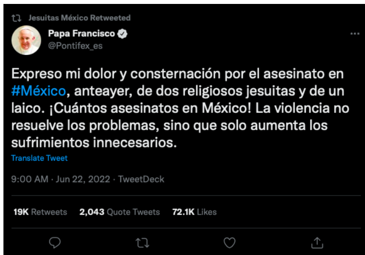
Imagen 7. Captura de pantalla del tuit que compartió el papa Francisco sobre los hechos de Cerocahui